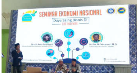
Advokasi Penanganan Pelanggaran Pemilu oleh prodi Hukum di Badan Pengawas Pemilu Kabupaten Probolinggo