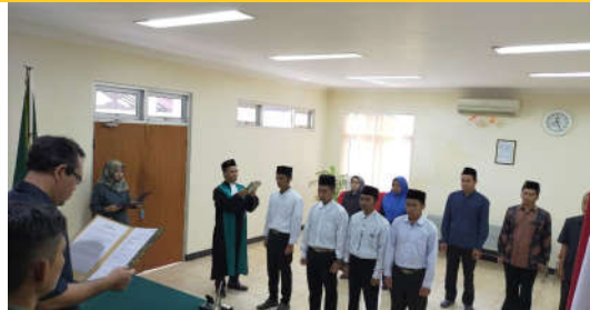
Pelantikan fresh graduate prodi HK/AS sebagai asisten hakim di Pengadilan Agama Kraksaan Probolinggo Jawa Timur