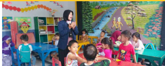
Kegiatan pendampingan anak usia dini oleh mahasiswa Prodi PIAUD di Taman Posyandu Anak Sholeh Nurul Jadid