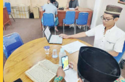
Uji Kompetensi Baca Tulis Alqur'an online ■

Agar menjadi lembaga yang kompeten dan profesional dalam melaksanakan uji kompetensi bidang keagamaan, LSK UNUJA bekerjasama dengan lembaga asosiasi dan/atau lembaga profesi sesuai bidang kompetensi yang akan diujikan diantaranya : ASWAJA CENTER NU, Rabitahah al – Ma'ahid al – Islamiyah (RMI), Jam'iatul Qurra' Wal Huffadz (JAMQUR).