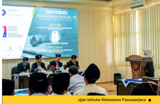
ujian terbuka Mahasiswa Pascasarjana ■