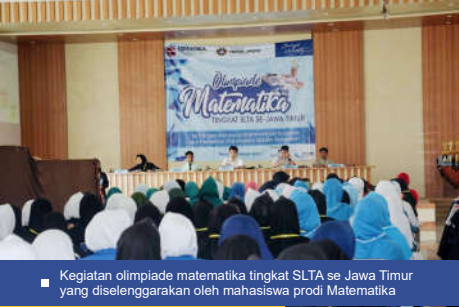
Kegiatan olimpiade matematika tingkat SLTA se Jawa Timur yang diselenggarakan oleh mahasiswa prodi Matematika