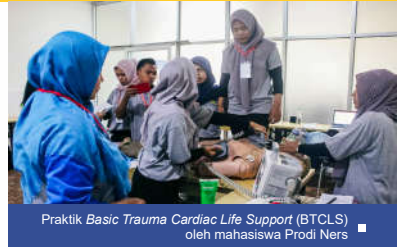
Praktik Basic Trauma Cardiac Life Support (BTCLS) oleh mahasiswa Prodi Ners