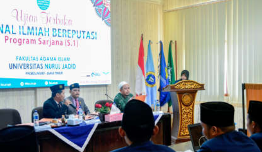
Ujian Terbuka Jurnal Ilmiah Bereputasi Mahasiswa Prodi Pendidikan Agama Islam (PAI)