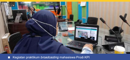
Kegiatan praktikum broadcasting mahasiswa Prodi KPI

Tenaga ahli yang memiliki kemampuan meneliti, mengevaluasi, dan mengembangkan lembaga pendidikan Islam berbasis scientific approach pada lembaga pendidikan formal dan non formal