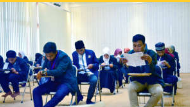
Mahasiswa Universitas Nurul Jadid saat mengikuti test TOEFL Institutional Testing Program (ITP) ■

Program sertifikasi khusus bidang kebahasaan bertujuan untuk menciptakan lulusan yang memiliki kompetensi bidang kebahasaan (Arab, Inggris, dan Mandarin).