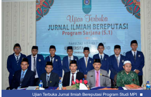
Ujian Terbuka Jurnal Ilmiah Bereputasi Program Studi MPI