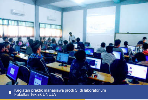
Kegiatan praktik mahasiswa prodi SI di laboratorium Fakultas Teknik UNUJA