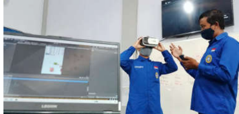
Mahasiswa prodi IF melakukan pengembangan aplikasi virtual reality dan Augmented Reality untuk Pembelajaran