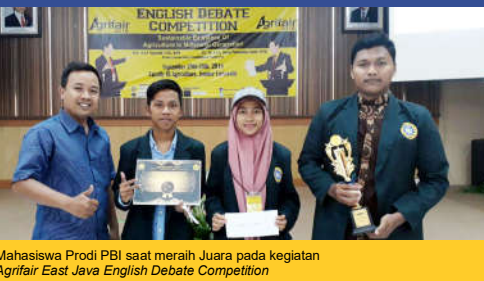
Mahasiswa Prodi PBI saat meraih Juara pada kegiatan Agrifair East Java English Debate Competition