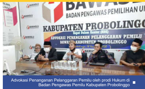
Advokasi Penanganan Pelanggaran Pemilu oleh prodi Hukum di Badan Pengawas Pemilu Kabupaten Probolinggo