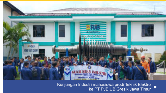
Kunjungan Industri mahasiswa prodi Teknik Elektro ke PT PJB UB Gresik Jawa Timur