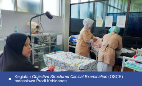
Kegiatan Objective Structured Clinical Examination (OSCE) mahasiswa Prodi Kebidanan