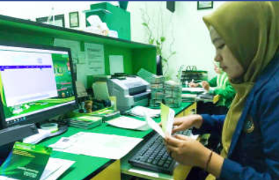
Kegiatan magang mahasiswa Prodi PS di BMTNU Jambesari Bondowoso Jawa Timur

Konsultan ekonomi dan bisnis yang profesional dan kompeten.