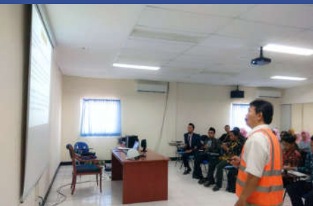
■ Kunjungan Industri dan Kuliah Manajemen Mutu berstandar ISO 9000. di PT. Palton Operation & Maintenance Indonesia (POMI)

Konsultan yang memiliki kemampuan memberikan pembinaan dan pendampingan terhadap pembelajaran PAI yang inovatif, efektif dan efisien.