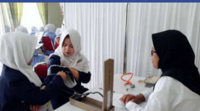
Praktik klinik Kompetensi Keperawatan Medikal Bedah di RSUD dr. H Koesnadi Bondowoso

Program Studi Keperawatan memiliki misi strategis dalam mensinergikan antara kajian ilmu kesehatan khususnya ilmu keperawatan dan kesehatan komplementer dalam pelaksanaan tridharma perguruan tinggi yaitu di bidang pendidikan, penelitian dan pengabdian masyarakat dengan tema-tema keperawatan komplementer. Oleh karenanya, tujuan dari Program Studi Keperawatan adalah sebagai berikut: