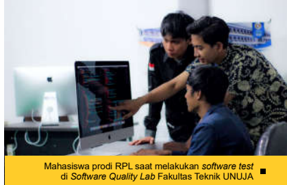
Mahasiswa prodi RPL saat melakukan software test di Software Quality Lab Fakultas Teknik UNUJA