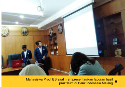
Mahasiswa Prodi ES saat mempresentasikan laporan hasil praktikum di Bank Indonesia Malang